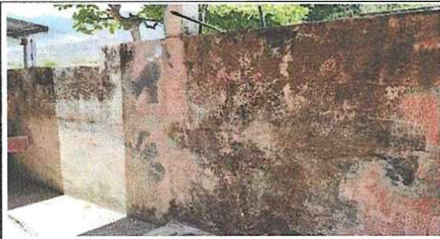
FOTO 1 PINTURA EN PAREDES DE LOS SANITARIOS.