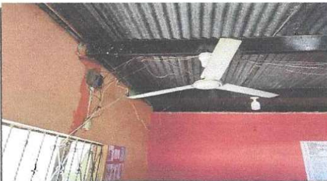
FOTO 3. INSTALACIÓN ELÉCTRICA EN MAL ESTADO.