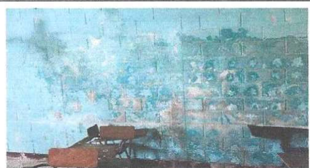
FOTO 2 PINTURA EN AULAS DE TODO EL ESTABLECIMIENTO